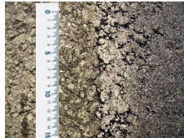
写真-6 縦ジョイント部