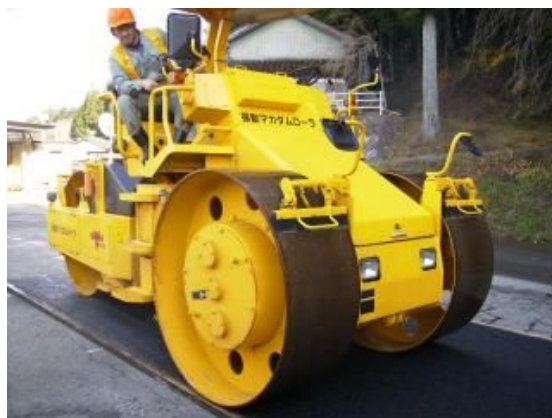
写真-1 振動マカダムローラ

振動マカダムローラ（以下、振動マカダムと称す）は、従来のマカダムと比べて小型、軽量ながら全輪（3輪）に振動機構を装備し、マカダムクラスでは最大の動線圧（110kgf/cm）を有する。また、左または右の前輪を独立して振動（通常振動と水平振動の切替式）できるので、舗装端部のみに振動を加えられる等、これまで小型振動ローラやプレートコンパクタによる人力仕上げ作業を省略し、迅速で安全な転圧作業を実現しうる特徴を有する。