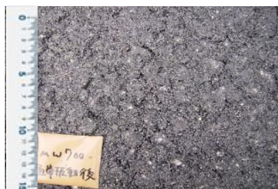
写真-4 初期転圧後の路面

試験施工の結果より、3工区で設定した振動マカダムと振動タイヤの組合せにより実施工を行った。写真-4に示すように初期転圧から骨材の良好な噛合せが見られ、写真-5に示すように二次転圧完了後、モルタルの充填効果が促進され路面全体で均一な表面性状を得ることができた。さらに、写真-6に示すように縦ジョイント部では、既設舗装との接合面が滑らかで同一の高さにて仕上げを行うことができた。