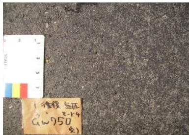
写真-5 二次転圧後の路面