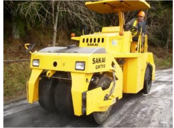
写真-2 振動タイヤローラ

振動タイヤローラ（以下、振動タイヤと称す）は、従来のタイヤと比べて小型、軽量ながら、4段階の振幅を設定できる振動機構を装備している。最大振幅時には 25t タイヤローラと同等以上の締固め効果を得ることができる。この振動により、タイヤ固有のニーディング作用を助長させ、骨材の噛合せならびにモルタルの充填効果が向上する 2) 。