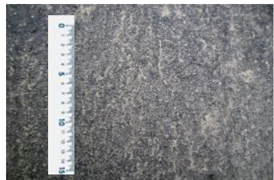
写真-3 3工区での路面状態