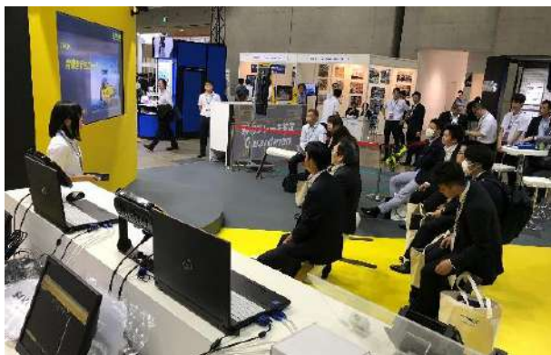
酒井重工業ブースでのプレゼン状況

酒井重工業もまた、本 CSPI-EXPO に出展し、生産性、安全性および締固め品質向上を推進すると共に、締固め機械の自動化についても開発を進めています。第3回 CSPI-EXPO では、品質向上を目指した転圧管理システム、安全性向上を目指した緊急ブレーキシステム、転圧施工の自動化に寄与する自律走行ローラを出展する予定です。酒井重工業は、IoT を AI (Artificial Intelligent) で分析し予知・予測に活かすまでを視野に入れ、これに基づく新たな付加価値の創造とお客様への提案することを目的としています。酒井重工業の次世代技術を体験頂く為にも、是非とも弊社展示ブースにお立ち寄り下さい。