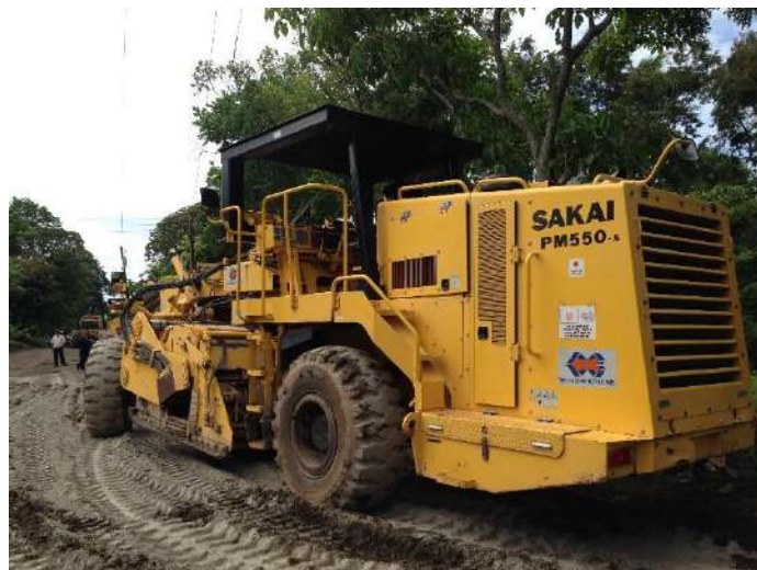
ニカラグアでの ODA の様子