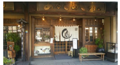
絶品あなごめしの「うえの」