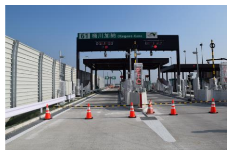
桶川加納 IC 料金所