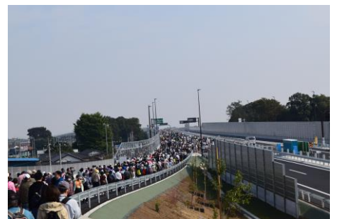
スタート直後の様子