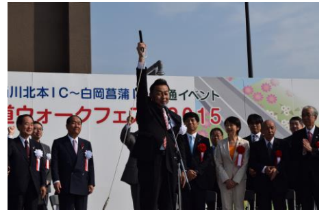
桶川市長の号砲一発でスタート！

今後、茨城県内の境・古河 IC からつくば中央 IC 間が開通すれば東名高速から成田空港までさらに便利になるという圏央道に期待しましょう。