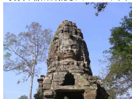
写真2：バイヨンの微笑と言われている