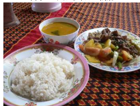
写真5：道端の食堂で食べた定食？