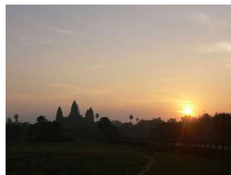
写真1：朝日に映えるアンコールワット