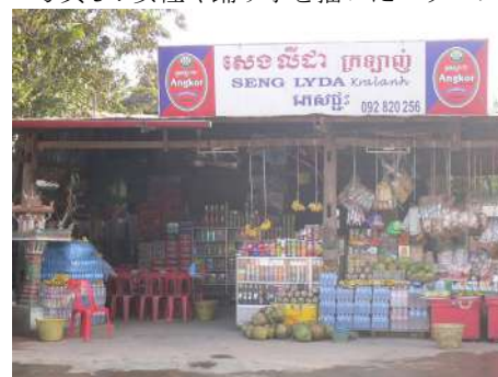
写真4：おばちゃんの商店