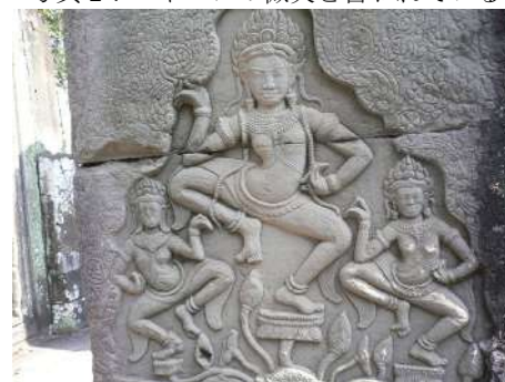
写真3：女性や踊り子を描いたレリーフ