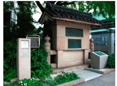
日本橋由来記の碑