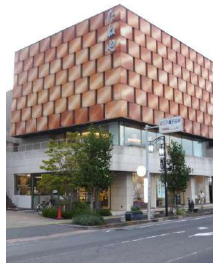
クラブハリエ 近江八幡駅前店

バームクーヘンで有名な「CLUBHARIE クラブハリエ」の本店は、日牟禮八幡宮のすぐそばにあり、歴史を感じさせる店構えで休日には多くの観光客が押し寄せます。元は江戸時代、穀物類や根菜類の種子を商う「種屋」を創業し1872年（明治5年）7代目当主の時、栗饅頭と最中を製造販売する和菓子店に商売替えし、屋号を「種屋末廣」としました。1951年（昭和26年）建築家で有名なウィリアム・メレル・ヴォーリスの勧めで8代目が洋菓子の製造を開始し、後のクラブハリエの基となりました。1967年（昭和42年）近江八幡駅前店（写真）への出店を皮切りに株式会社「たねや」を設立し、1984年（昭和59年）には日本橋三越本店と銀座三越に進出を果たすなど、滋賀県を代表する菓子メーカーに成長しました。今やクラブハリエは、滋賀県を始め東京、横浜、名古屋、大阪に12店、和菓子の「たねや」を含めると40店、2011年売上げは192億にもなります。一層一層職人の手で丹念に焼き上げるこだわりのバームクーヘン。素材への徹底したこだわりと昔ながらの製造法を守りつつ、長年工夫を重ねてふんわりしっとりとした深い味わいです。特に女性に人気があり、一度お楽しみあれ・・・。