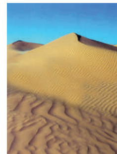
チュニジアの地図とサハラ砂漠

北アフリカにあるチュニジアは、民族的には中東（アラブ）に属し、地中海文化圏に含まれています。チュニジア料理もまさにそれらの特徴を備えています。