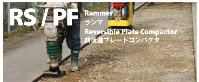
RS / PF Rammer ランマ Reversible Plate Compactor 前後進プレートコンパクタ