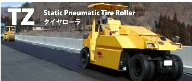
TZ Static Pneumatic Tire Roller タイヤローラ