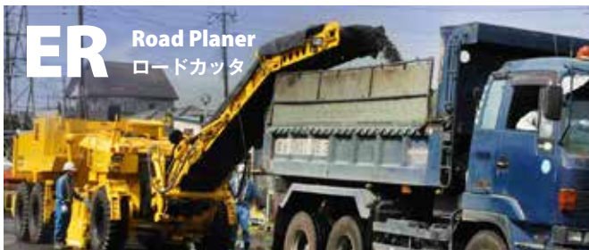
ER Road Planer ロードカッター