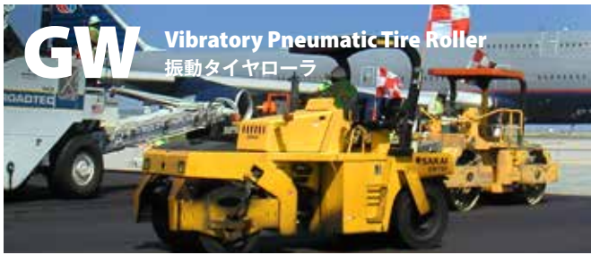
GW Vibratory Pneumatic Tire Roller 振動タイヤローラ