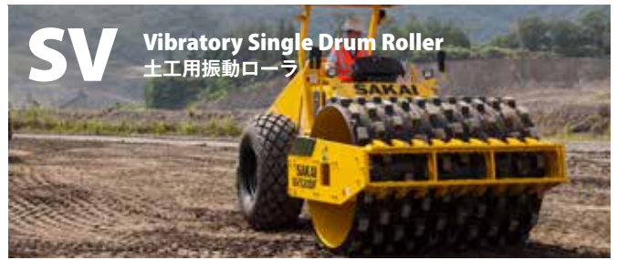
SV Vibratory Single Drum Roller 土工用振動ローラ