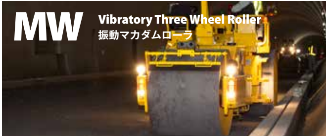
MW Vibratory Three Wheel Roller 振動マカダムローラ