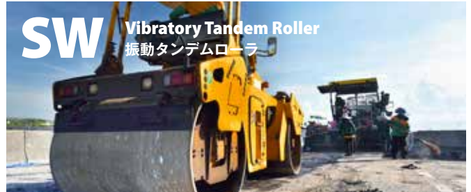
SW Vibratory Tandem Roller 振動タンデムローラ