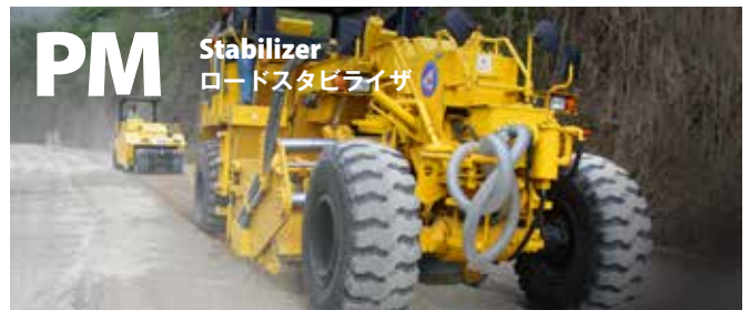
PM Stabilizer ロードスタビライザ